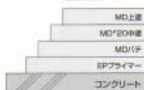
適用例 7 鉄道高架橋